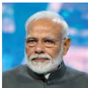
НАРЕНДРА МОДИ Премьер-министр Индии