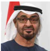
АЛЬ НАХАЙЯН, МУХАММЕД БЕН ЗАИД

Президент Объединённых Арабских Эмиратов