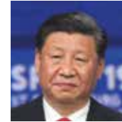
XI JINPING Président de la République populaire de Chine

« Les ponts du partenariat entre la Russie et les Émirats arabes unis sont jetés et nous y travaillons activement. Nous construisons des relations solides et fortes. Je vous remercie d'avoir donné aux entreprises émiraties l'occasion de s'exprimer lors de ce forum. Ce forum joue un rôle très important cette année. Je pense que la coopération entre les secteurs privés de nos deux pays joue un rôle important dans le développement de nos relations bilatérales. Par exemple, le tourisme bilatéral se développe très fortement : nous espérons accueillir un million de touristes russes cette année. Il s'agit d'une étape et d'un moment très importants dans le développement de nos relations. »