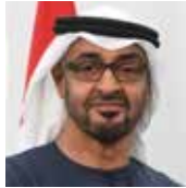
MOHAMMED BEN ZAYED AL NAHYANE Président des Émirats arabes unis