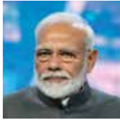
NARENDRA MODI Premier ministre indien